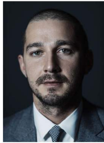
SHIA LABEOUF John McEnroe