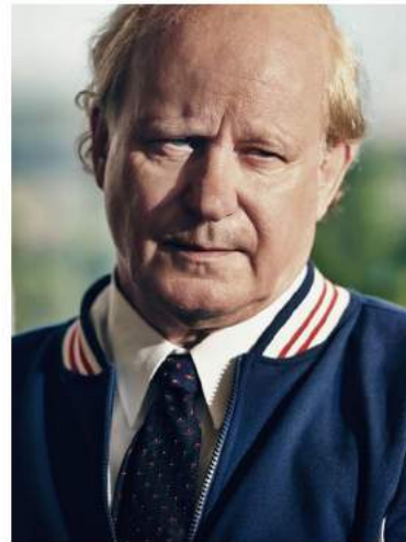
STELLAN SKARSGARD Lennart Bergelin