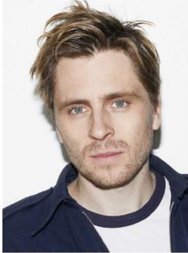
SVERRIR GUDNASON Björn Borg