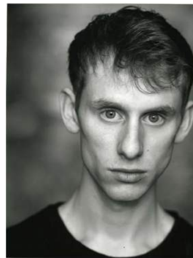
Vitas Gerulaitis